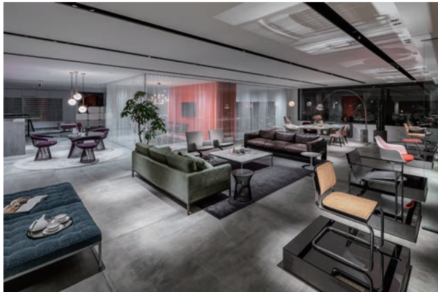
往年の名作から最新のファニチャーまでを展示。

1947年に Florence Knoll によって設立された Knoll Textiles は、商業用インテリアのファブリックニーズに対応する最初の会社です。現在、Knoll Textiles は北米最大のテキスタイルサプライヤーの1つで、医療、ホスピタリティ、教育のために開発された製品を備えています。