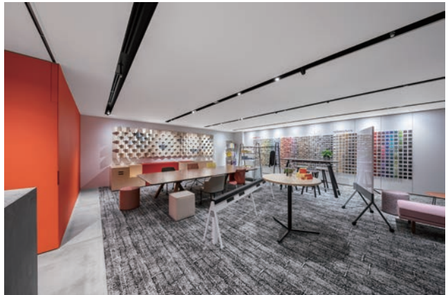
1000種類を超えるテキスタイルサンプルをご覧いただけます。