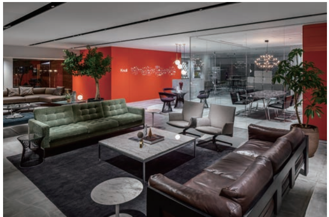
Knollのアイコン的なカラーであるレッドを基調としたショールーム

■ 本件に関するお問い合わせ：画像のお貸出し、ご取材などご希望の際は、下記プレス担当までご一報ください。