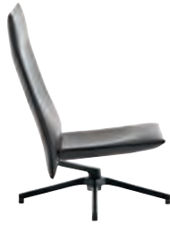
High Back Chair without arms