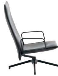
High Back Chair with charcoal arms