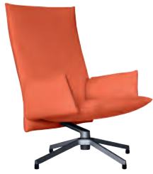
High Back Chair with upholstered arms