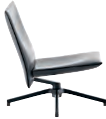
Low Back Chair without arms