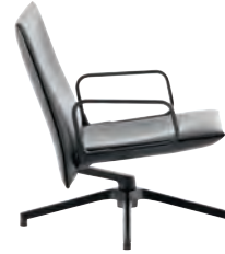
Low Back Chair with charcoal arms