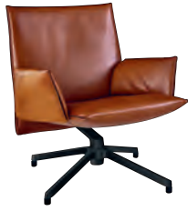
Low Back Chair with upholstered arms